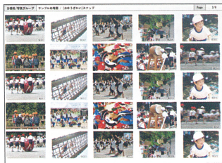
インデックスプリントのイメージとそれに対応した販売画面（スマホ）

また、ネットへの写真掲示を嫌う学校への対策として、ネット上に写真を公開することなくインデックスプリントの番号のみで注文を受けるシステムを開発。すなわち、紙に出力をした状態で写真を選択し、注文のみその番号でネットを活用するハイブリッドな環境である。注文後の処理は、従来のPhotoStoreと変わらないので、学校の先生にとっては、安心と手軽さを両方手に入れることができるというわけだ。同社では「これを機に、ネット販売の許可が得られたユーザーも多くなる。ぜひ学校への段階的なプレゼンテーションの一助にしたい」としている。