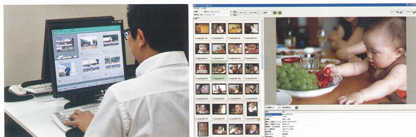
上：補正のイメージ。左から無補正→自動補正のみ→自動補正+手動補正。下左：手動補正作業の様子。1枚1枚膨大な量のデータを手動で補正する。下右：アップローダーのイメージ（画像は現在のシステムのものを表示）。